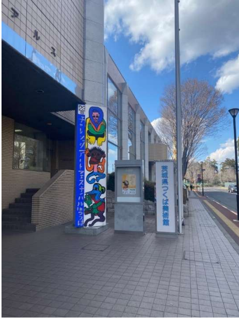
警備員室側入り口