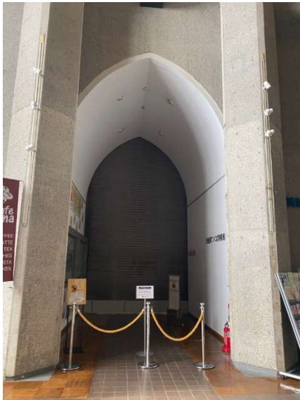
美術館の入口（本番の日はシャッターあいています）