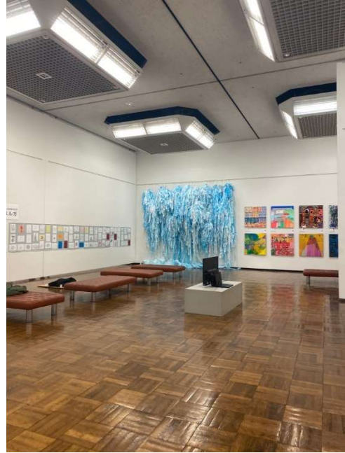
会場の様子（水色の前で演奏）